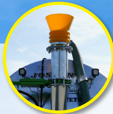
Lejek z tyłu