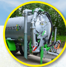
Z ramieniem pompującym lub bez