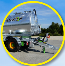
Tetraliner: dyszel Dolly z zawieszeniem pneumatycznym