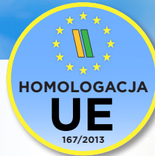
Homologacja UE 34 t